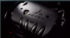
原装进口三菱MIVEC全铝发动机