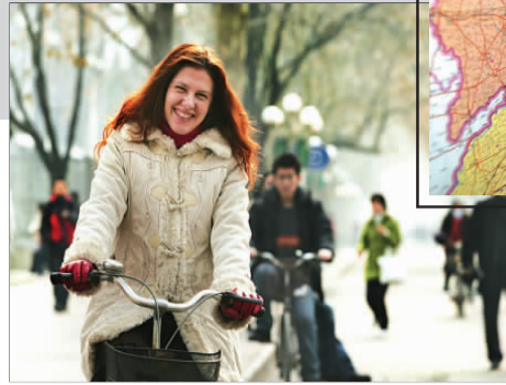
▲在中国地图上标注自己去过的城市。