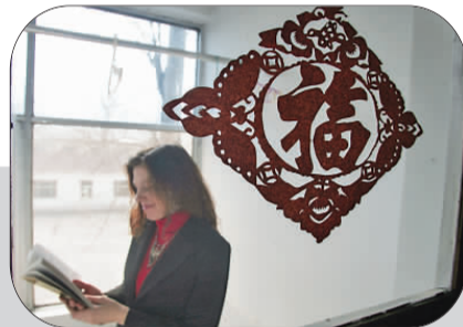
雅娜家里中国味十足。