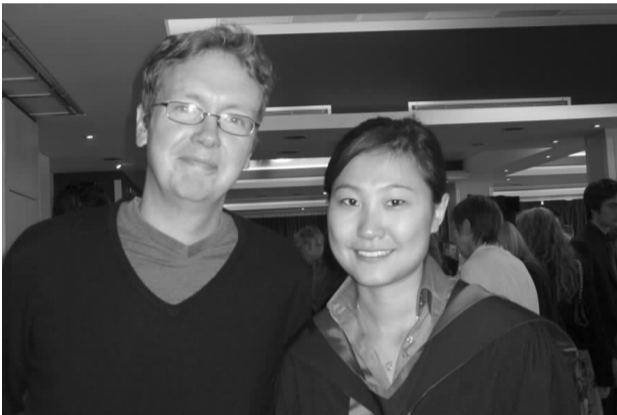
作者与学术导师在毕业典礼上的合影。

5天之后,公司对我们实习人员进行进行了工作面试,在经历了蹦极一样起伏跌宕,心惊肉跳的面试感觉之后,我终于如愿以偿了。