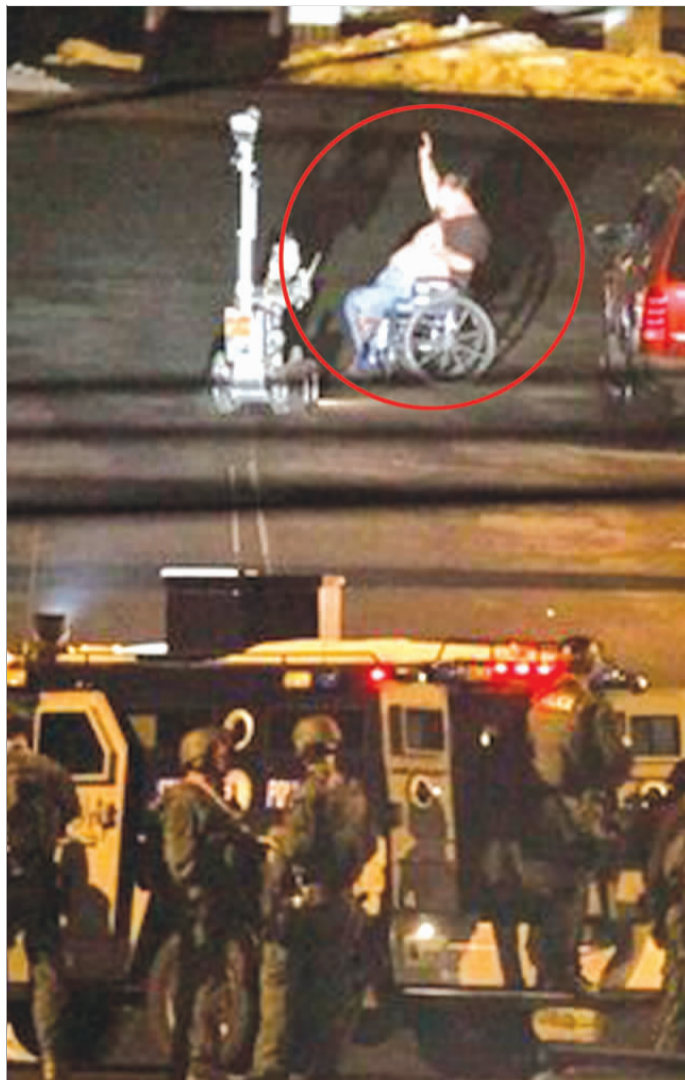
残疾男子坐在轮椅上向警方投降。