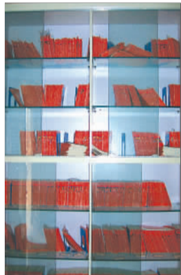
由于还有很多居民没有办理健康档案,专门放置健康档案的文件柜并不满。

入户上门、发信息表……中心工作人员想出了一系列方法,希望普及健康档案,却频频遭遇冷场。他们“戏言”,“上赶着”跟在市民屁股后面,“请”市民办理健康档案,却被市民以怕泄露隐私等理由婉拒。