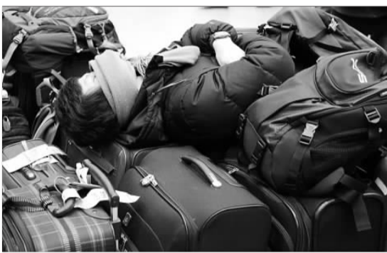
一名旅客在20日“欧洲之星”客运计划取消后躺在行李箱上睡觉。

据新华社伦敦12月20日电 在英国和欧洲大陆之间运行的“欧洲之星”列车19日晚再次出现故障,导致车上旅客被困途中,以致“欧洲之星”公司不得不取消20日的所有客运计划。 “欧洲之星”列车18日有4列列车因大雪出现故障。“欧洲之星”公司于19日晚再次发送一趟列车前往法国,但又因故障在英吉利隧道抛锚。另一列列车19日晚从巴黎开往伦敦,刚过英吉利隧