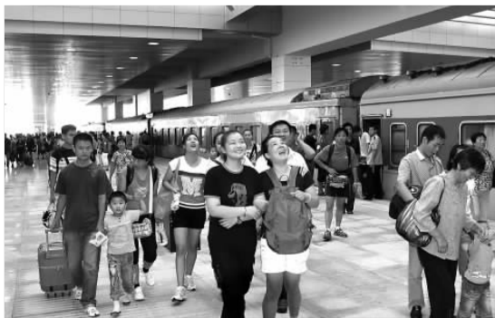
新火车站迎来第一批客人。(资料片)