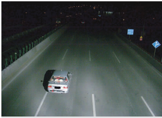
因超速被抓拍的超速车辆。

26日记者从交警部门获悉,经过安装调试成功的新型超速监测系统——车辆超速检测记录系统已经运用到了东西快速路上,该系统可以24小时对区间内的车速进行实时测量,一旦超车就将进行抓拍,交警将对超速者按照上限处罚,以减少因超速引发的交通事故起数。