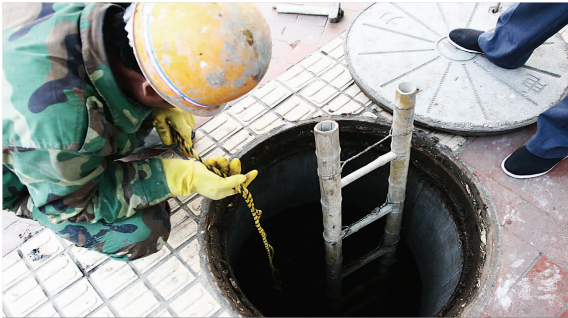
26日,在中山公园附近,青岛热电的工作人员正在清除电力井里面的废水。据了解,如果电力井里面的废水聚集时间过长,会形成沼气,给下井施工人员带来危险,所以每两年要清理一次。

处以500元罚款,交通违法记6分,可以并处吊销驾驶证的处罚;超速70%以上不到100%的,处以1000元罚款,交通违法记6分,可以并处吊销驾驶证的处罚;超速100%以上的,处以2000元罚款,交通违法记6分,可以并处吊销驾驶证的处罚。交警部门将严格按照这一标准进行处罚,希望广大驾驶人严格依法按规定时速行驶,不要超速行驶,以免引发交通事故。