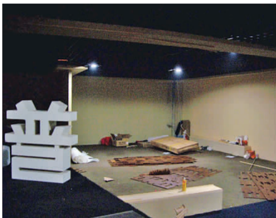
被搬空的家居店。

看起来富丽堂皇的家居商场却发生离奇事件。26日一早,嘉汇家居的三名业主突然发现,各自店内价值数十万元的家居货品一夜间不知去向,连衣物、鱼缸等非卖品也不见了踪影。记者了解得知,事情缘起租金纠纷。