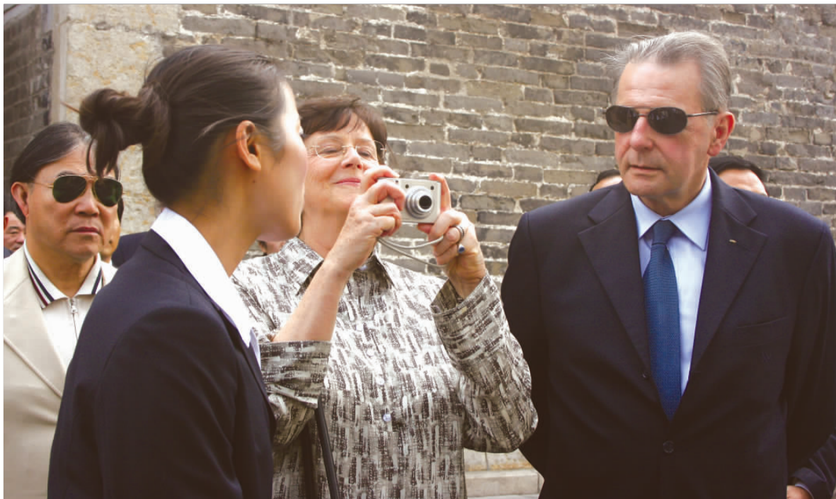
▲罗格夫妇兴致勃勃游山东。