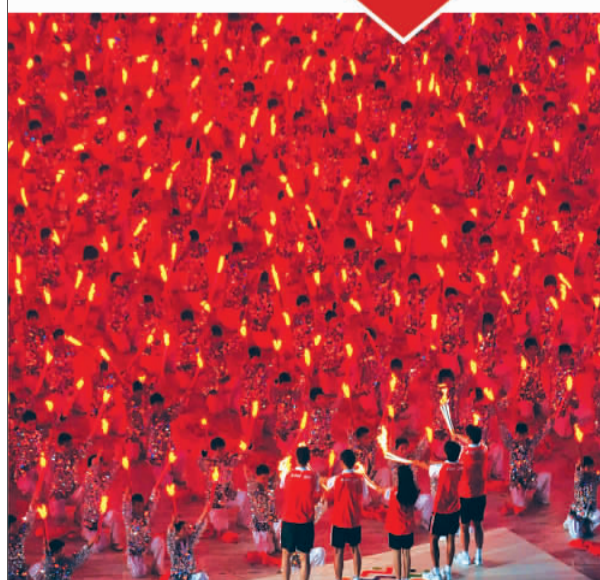
▲5名火炬手向参演人员传递圣火。