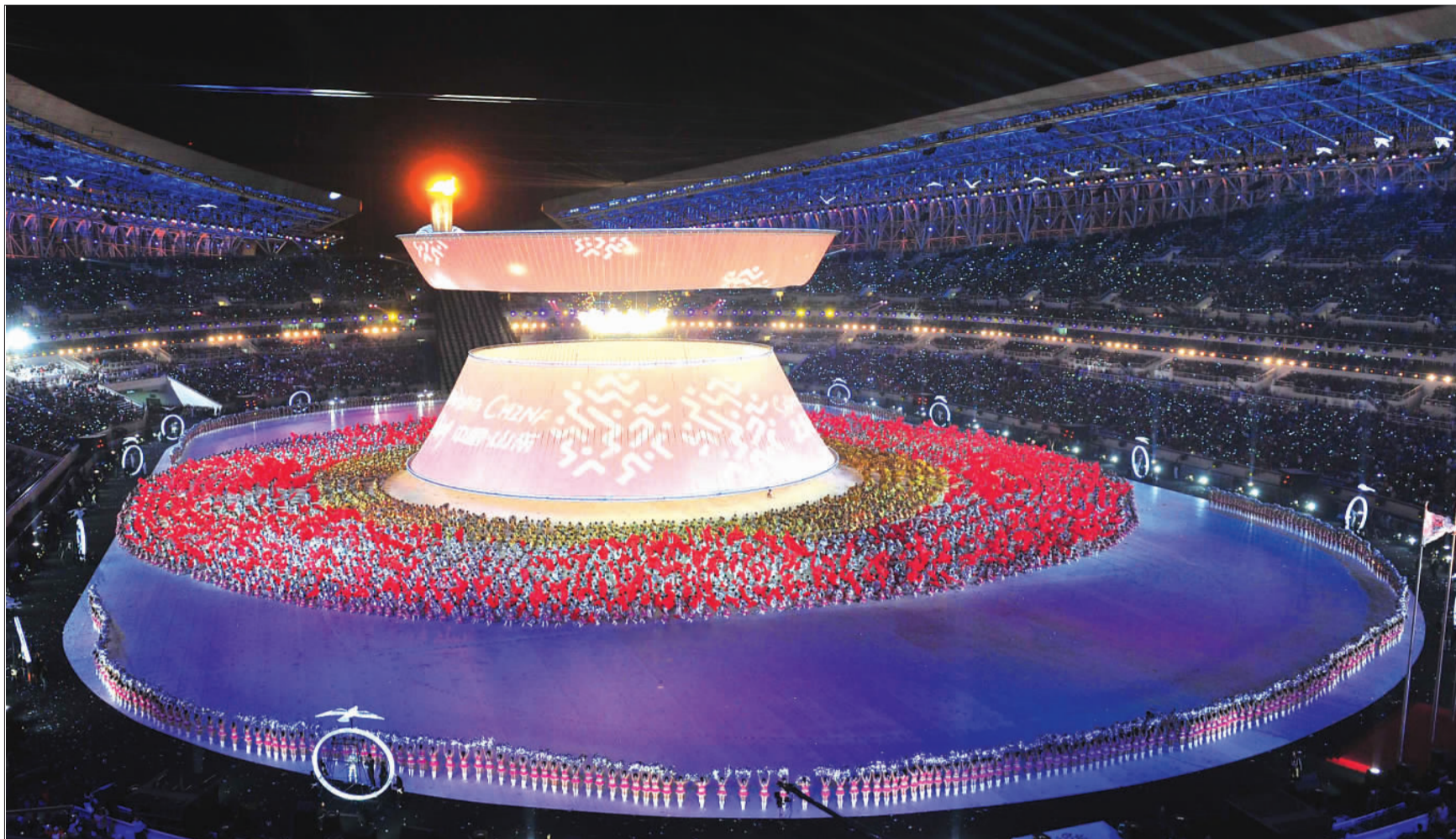
▲主火炬塔圣火熊熊燃起。