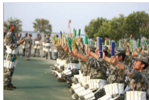
▲官兵排练点燃微型烟火。