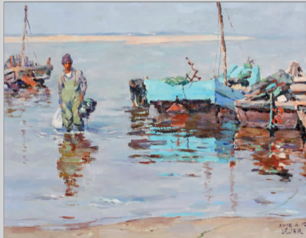
迟海波 《渔归》65cm × 80cm