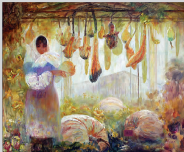
刘宏 《大棚的喜悦》150cm × 180cm