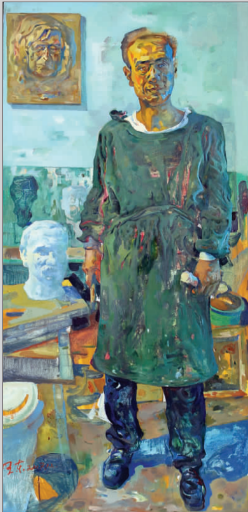
王东 《雕刻者》175cm × 89cm