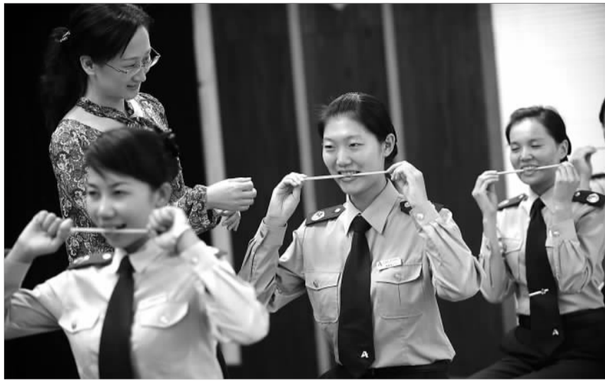
济青高速潍坊收费站的工作人员在练习微笑。

据山东高速股份收费管理部黄泽红副经理介绍，为推行“微笑服务”，公司7月初特意从最早推行微笑服务的广西高速请来了教练，对1200余名收费员进行了为期两个