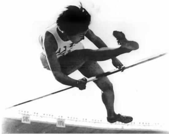
郑凤荣在“一运会”上获得荣誉奖章。