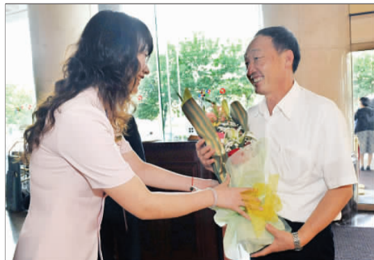
15日,许振超来济参加本报“功勋榜”活动。