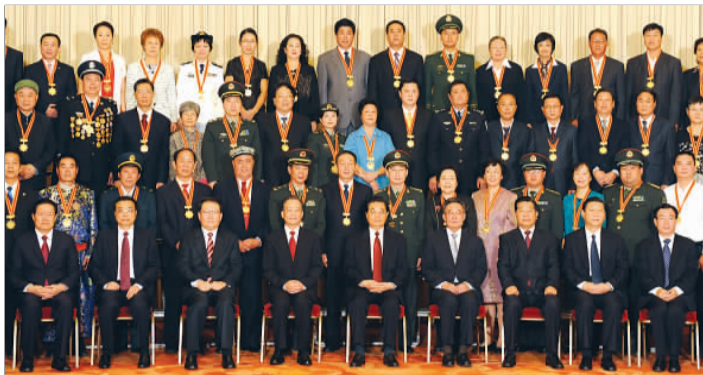
14日,许振超在京参加“双百”人物代表座谈会。

许振超深有感触地说:“当时大家都想在体育上争一口气,摆脱‘东亚病夫’的帽子,每个运动员在赛场上都为了国家荣誉而战,收音机里传来陈镜开打破世界纪录、庄则栋拿冠军的消息,令人无比振奋,实在是大快人心。”