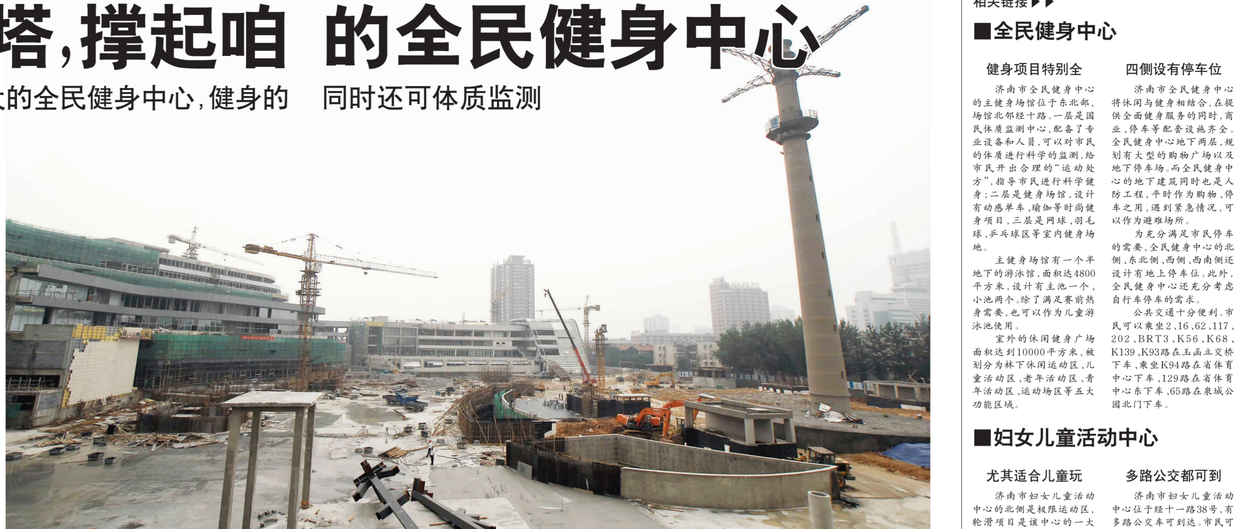
5日,济南市全民健身中心正在加紧施工建设,竣工日期尚不确定。

据了解,济南市全民健身中心原计划于今年8月中下旬完工,但是中心施工人员透露,由于种种原因,工程的竣工日期将会推迟。具体何时完工,负责施工的有关人士表示不好预测。