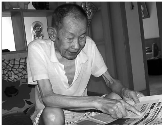
台旭展示相关报道。