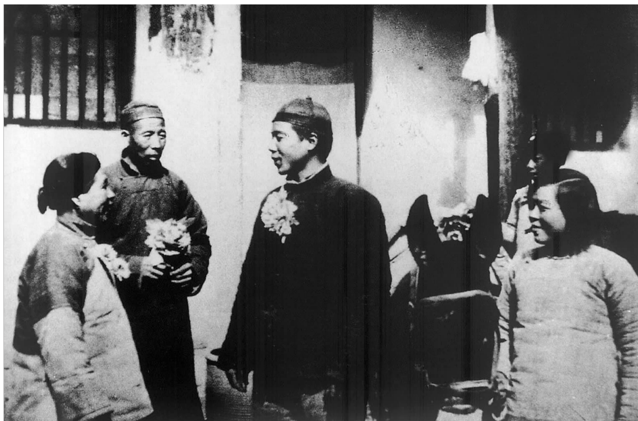
土改后分得土地的农民纷纷报名参军，一人参军全家光荣。