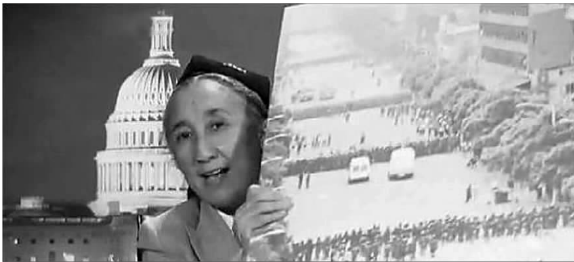
网友揭露,热比亚出示的这张被特别制作放大的照片,是湖北石首警方处理群体性事件时的照片。(资料片)

有外电称,中央民族大学一名维吾尔族副教授因牵涉乌鲁木齐“7·5”事件被羁押,此事是否属实?这位负责人说,经了解,中央民族大学没有因乌鲁木齐“7·5”事件受到刑事追究的维吾尔族教师。