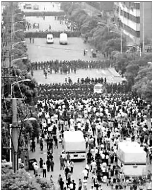
湖北石首警方处理群体性事件时的照片。(资料片)

而CNN主持人在原新闻节目中的解说是这样的:“我们不知道太多关于这个17岁伊拉克库尔德女孩的事情,但是我们被告知,她无视本族的规定,爱上一个异族的男孩,这石刑便是对她的惩罚。”