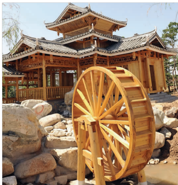
▲南宁园营造的民族风情。