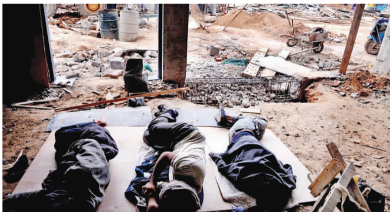
▲为赶工期,工人就地轮班休息。