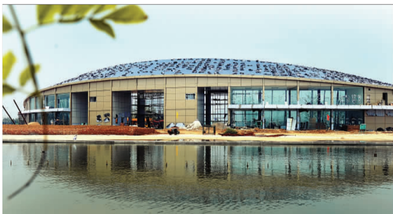
▲园博园主入口“水之门”倩影。