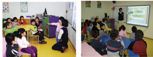
全球领先的高科技电子互动白板

“不出国门,就能上美国小学!”今年夏天,家长们纷纷都关注到一家较大规模的少儿英语培训机构——瑞思学科英语,理念是“在家门口上美国小学”。目前,在全国近90多家瑞思分中心已有数万4-12岁小朋友就读,学的是与美国公立小学同质同步的课程。