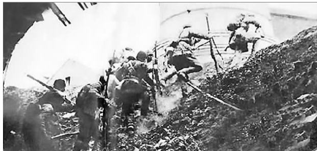
莱芜战役激战场面。(资料片)