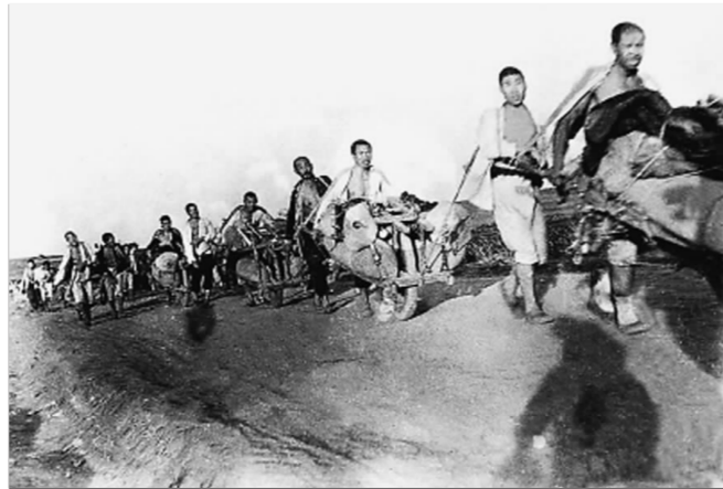
山东解放区的支前民工。(资料片)