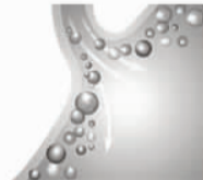
双歧杆菌快速清除胃部炎症处的有害菌

第一步:快速杀灭致病菌缓解症状 双奇中的高含量双歧杆菌30分钟开始消灭致病菌(如幽门螺杆菌,大肠杆菌等)。故而,轻度患者半小时开始缓解病痛。