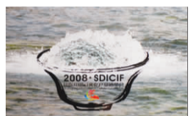
▲《泉》系列作品之《品》。 ▶《尚和》系列招贴之《点》。

济南大学艺术学院教授段轩如的《泉》系列作品《读》、《品》、《听》,以泉水为元素,以人们对文化的渴求为主题,取水的亲和、润泽的文化象征意义,将视觉元素转换为“知觉”、“味觉”和“听觉”,从“读”、“品”、“听”不同的方面体会齐鲁文化的博大精深与精妙。