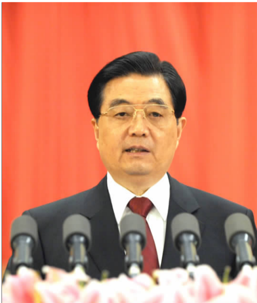
胡锦涛在会上发表重要讲话。