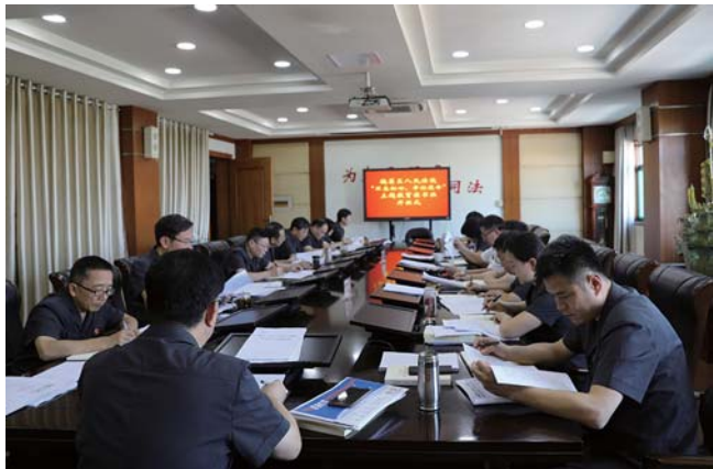
处级以上干部集中学习。