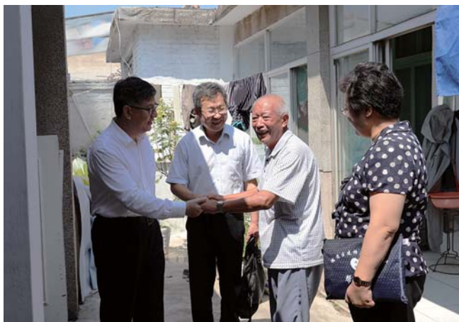
走访帮扶困难群众。

全院党员真查真改；带头制定落实各项制度，引领全院党员提高工作规范化水平，形成“头雁效应”。同时，自觉接受指导督导，确保主题教育实效。