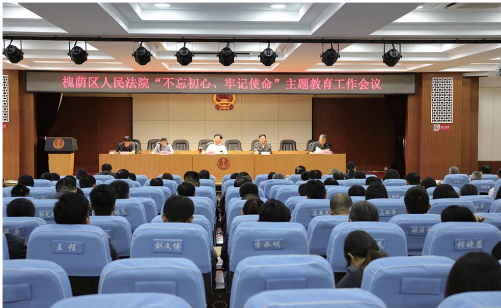
深入动员，广泛发动。

召开由全院党员、干警和退休党员参加的主题教育工作会议，充分利用法院e家等新媒体广泛宣传，制定《实施方案》，成立由党组书记任组长、副书记任副组长、班子成员为成员的领导小组及办公室。抓住领导干部“关键少数”，既挂帅又出征，要求做到“六带头、六引领”：带头参加学习，引领全院党员掀起理论学习热潮；带头深入基层群众，引领全院党员践行群众路线；带头查摆剖析问题，引领全院党员担当作为；带头开展批评与自我批评，引领全院党员加强党性锻炼；带头抓好整改，引领