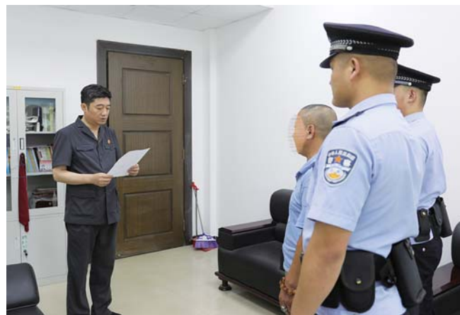
用好强制措施，切实解决执行难。