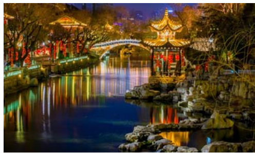
▲济南护城河夜景。