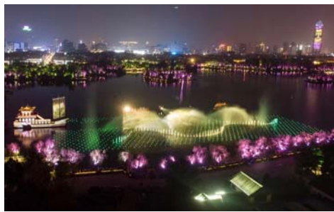
▲“明湖秀”灯光秀。

款代表济南文化特色的文创产品，推动文创产品进景区、进饭店、进商街、进机场、进车站等夜间消费场所展示销售，促进济南文化旅游夜消费； 六、启动百场泉城夜休闲文旅沙龙活动。围绕促进夜游经济发展话题，开展泉城之夜“围炉夜话”百场文旅沙龙活动，学习先进城市经验，为济南夜经济发展献策支招； 七、启动百名“夜游达人”评选活动。面向社会招募爱夜游、爱生活、爱探索、爱发现、爱分享的100名各领域“夜游达人”，分享了他们眼中的济南夜休闲文化故事，为市民游客提供新颖、实用、权威的夜休闲建议和攻略。评选出的