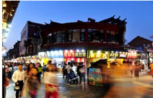
▲人流攒动的芙蓉街。