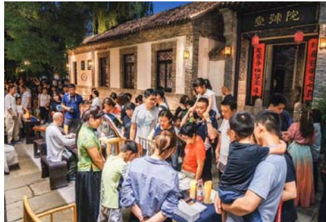
▲明府城小南湖夜市。