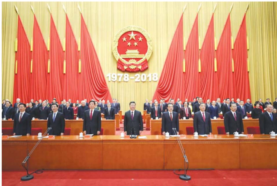
12月18日,庆祝改革开放40周年大会在北京人民大会堂隆重举行。习近平、李克强、栗战书、汪洋、王沪宁、赵乐际、韩正、王岐山等出席大会。