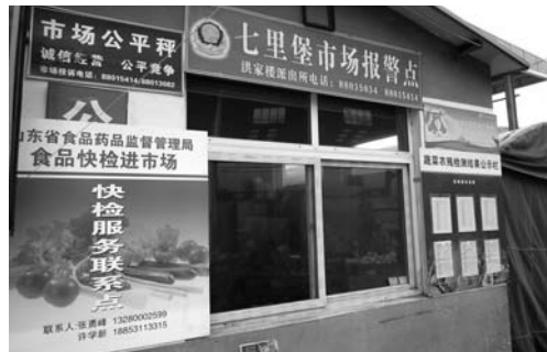
设置在济南市七里堡蔬菜批发市场的标识牌。

据统计, 截至2月3日下午6点, 全省共有150个县(市、区)在346个商场超市、农贸市场、批发市场、餐饮店等集中经营消费场所, 全面开展了食品快检活动。省食药监局相关负责人表示, 此次活动充分发挥了问题食品快检筛查的作用, 及时发现和排除了春节期间食品消费风险, 强化了市场开办者和食品经营者主体责任。而快检发现的问题食品, 将在相关网站进行公示, 并根据实验室检验确认结果开展跟踪追溯抽检, 依法严厉查处不合格食品经营行为。