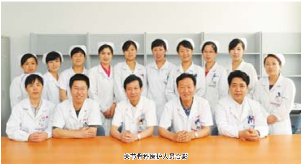
关节骨科医护人员合影