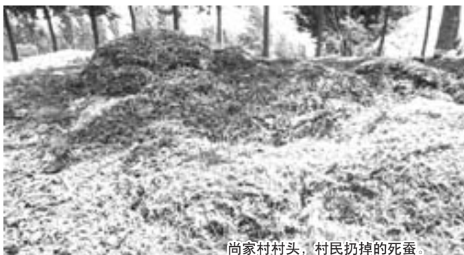
尚家村村头,村民扔掉的死蚕。

蚕农的损失到底有多大?有村民给记者算了一笔账。每张春蚕的产量大约在90-100斤,去年蚕价达到了历史最高点——每斤23.5元左右。今年,春蚕收购价一路飙升,蚕农预计今年春蚕价格将达到每斤26元左右。他们估算,不计人工和投入成本,龙居镇蚕农的损失将会在1000万元以上。