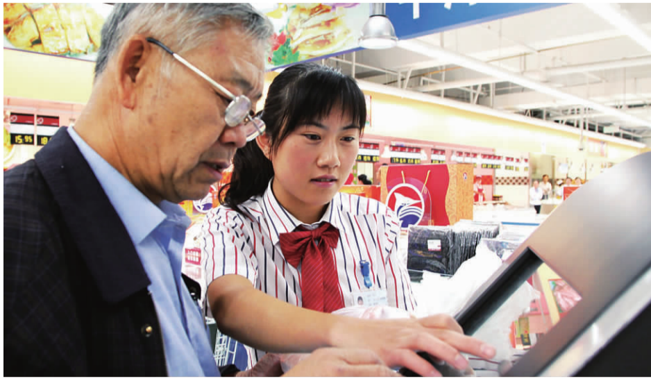
◆导报记者 吴淑娟 济南报道

山东省政府日前出台《关于加快推进农产品品牌建设的意见》,提出将加快推进农产品品牌建设,打造以品牌价值为核心的新型农业。规划到 2015 年完成山东农产品整体品牌形象的设计方案,并向国内外正式推出。到 2020 年,实现整体品牌形象在国内外具有较高的知名度和影响力,品牌价值达到 100 亿元以上。