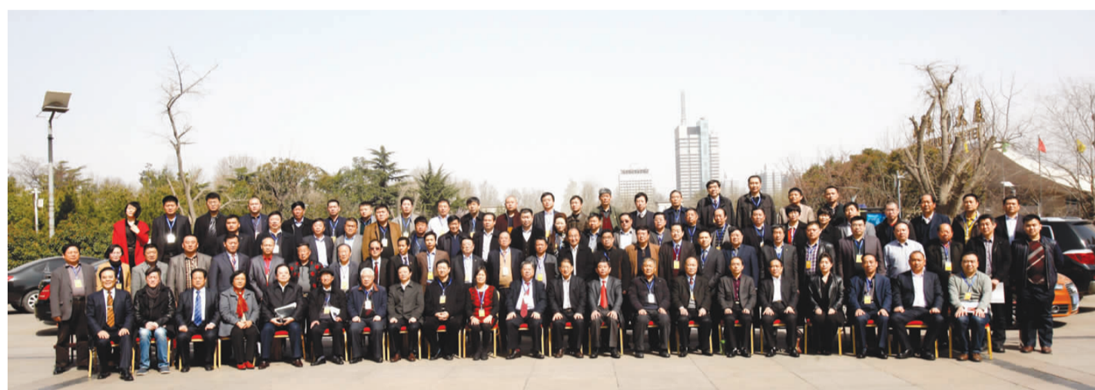
与会人员合影留念