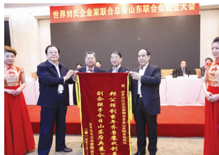
世界刘氏企业家联合会赠送祝贺锦旗