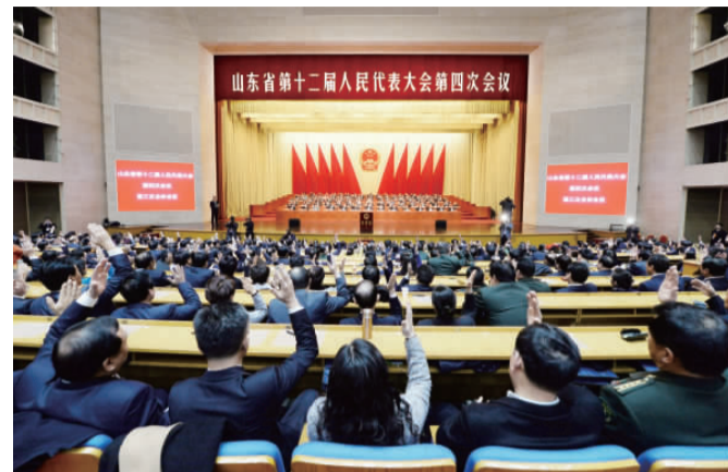
2月1日,山东省第十二届人民代表大会第四次会议在山东会堂胜利闭幕