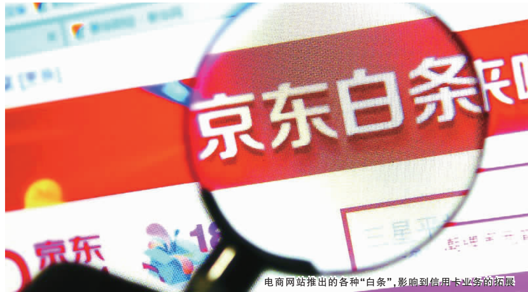
电商网站推出的各种“白条”,影响到信用卡业务的拓展