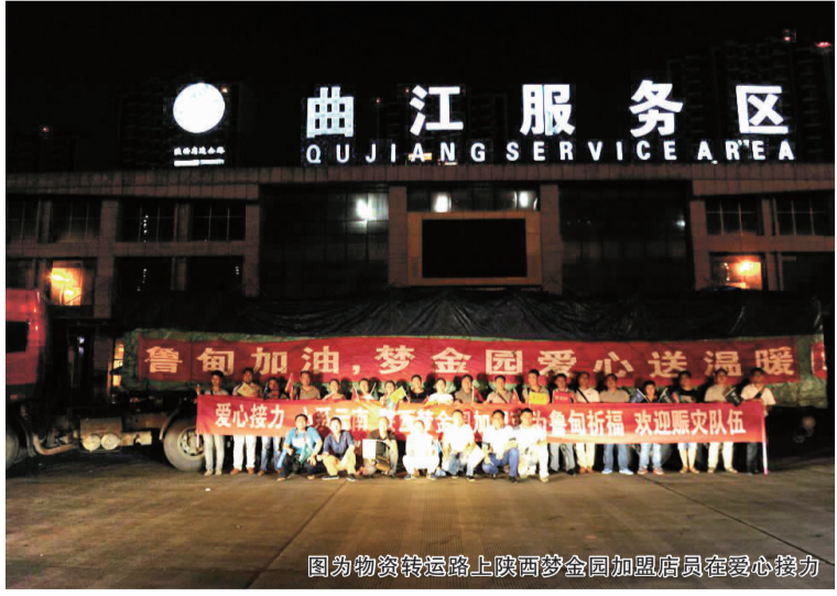
图为物资转运路上陕西梦金园加盟店员工在爱心接力

云南鲁甸地震发生后,灾情牵动着全国人民的心,全国各地迅速行动,积极支援鲁甸地震灾区。