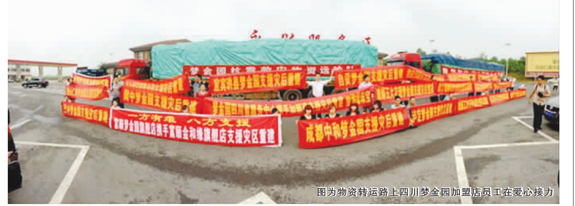
图为物资转运路上四川梦金园加盟店员工在爱心接力