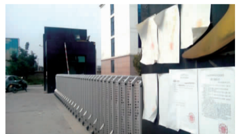
山东蓝天重工生产厂区大门的柱子上,贴满了法院的开庭通知书、裁定书、查封通知书等

“企业互保曾被一些金融机构视为很好的模式,现在看来这种模式的风险很大,一旦一个企业垮掉,就会牵出一系列风险事件。”山东某大型担保公司负责人对导报记者分析说,“与企业互保相比,通过担保公司担保,也许是一种更好的模式。”