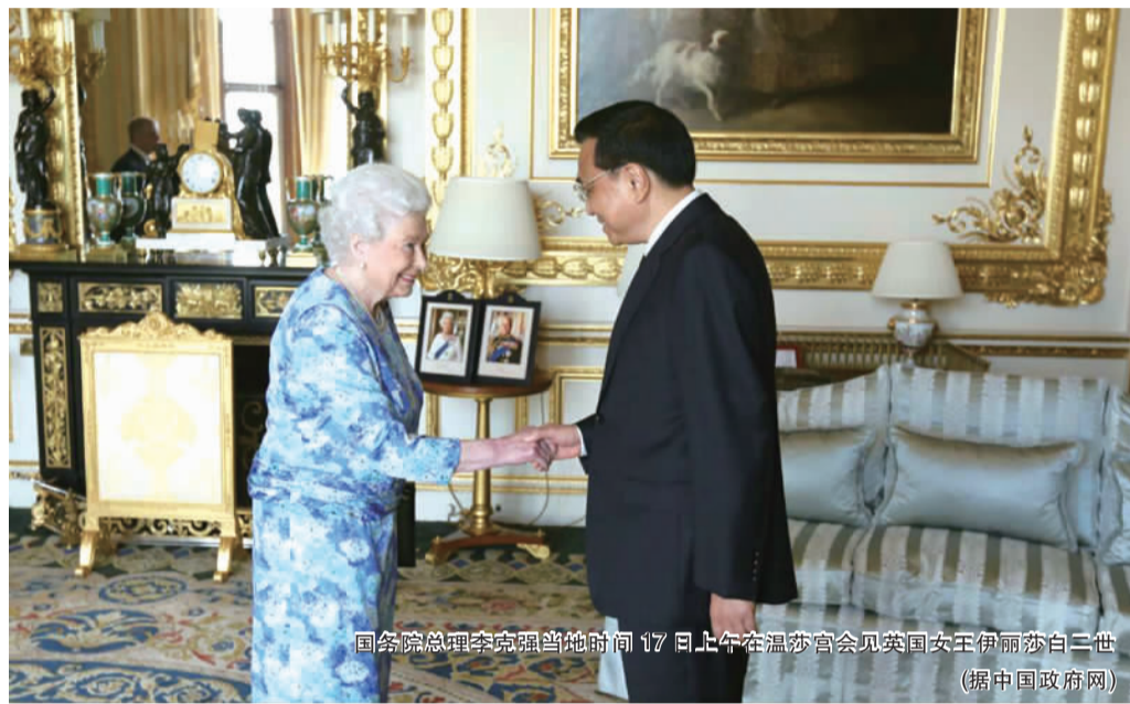
国务院总理李克强当地时间17日上午在温莎宫会见英国女王伊丽莎白二世 (据中国政府网)

中英两国在高科技、金融、能源等领域展开新合作,有利于打破美国等设置的贸易壁垒,进入高端产业,提高中企的研发能力