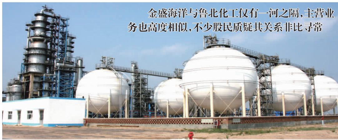
金盛海洋与鲁北化工仅有一河之隔,主营业务也高度相似,不少股民质疑其关系非比寻常