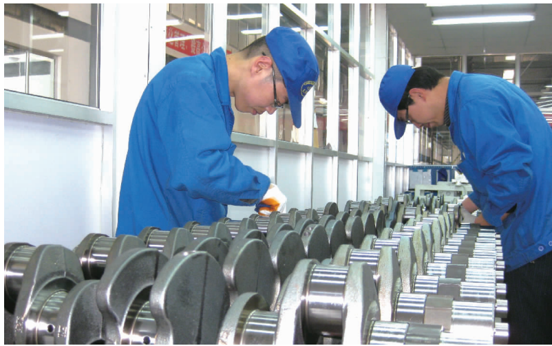
通过先进设备和技术的进口,潍坊诸多企业的技术水平实现跨越式提升

潍坊市把争取进口贴息资金作为推动产业结构调整和经济增长方式转变的有力抓手,3年累计争取15594万元,惠及企业79家次