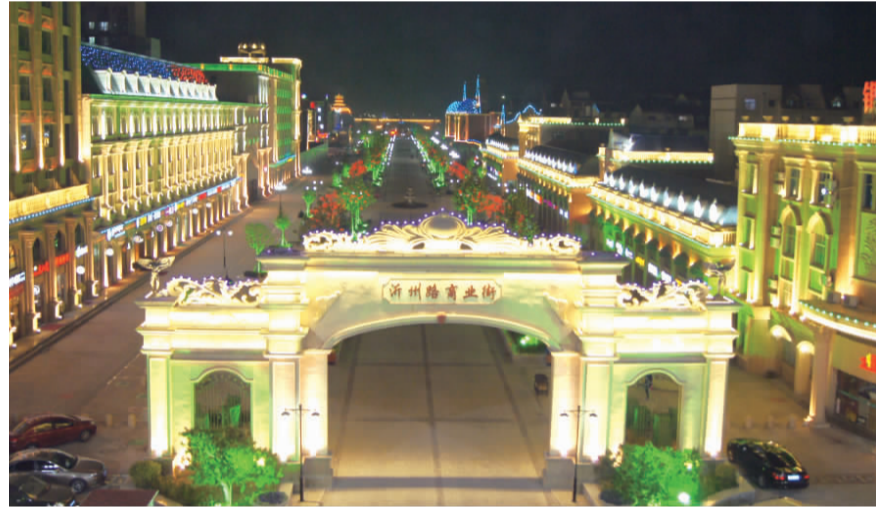
沂州路商业街夜景