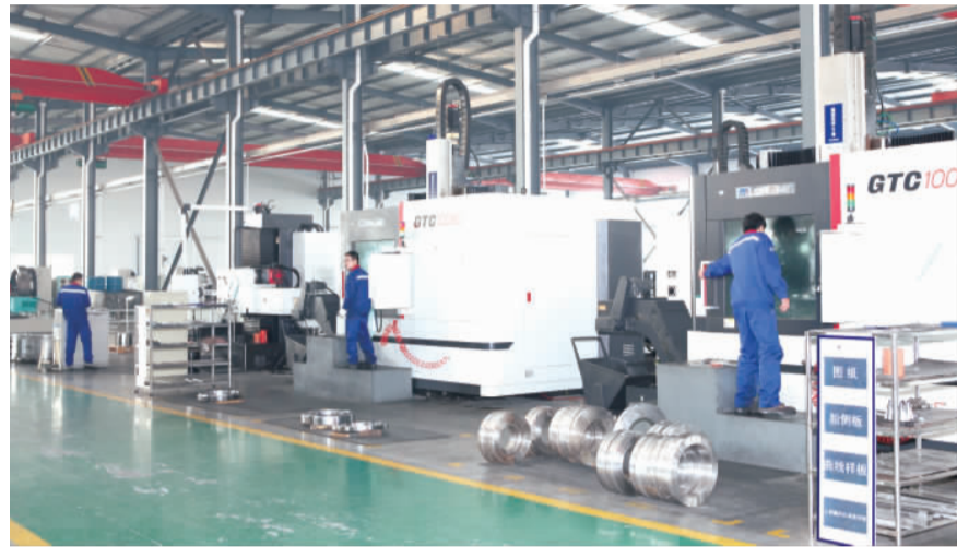
恒益模具生产车间一角

东营市委书记刘士合说,“当前,东营站在了新的起点上,具备了向更高层次更高水平发展的基础和条件。全市上下人心思上、风正劲足,干事创业的热情高涨,这是我们推动新一轮发展的最可靠保障。只要我们抢抓机遇,积极作为,完全可以实现更好更快发展,‘两个率先’的目标一定能实现。”