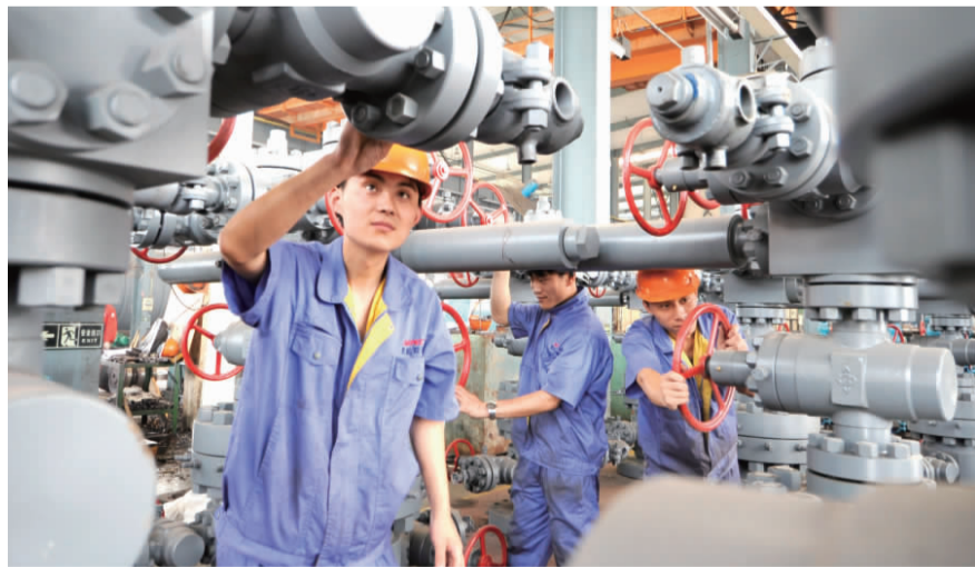
大项目带动大产业