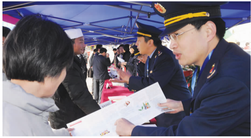
工商执法人员向群众宣传消费知识