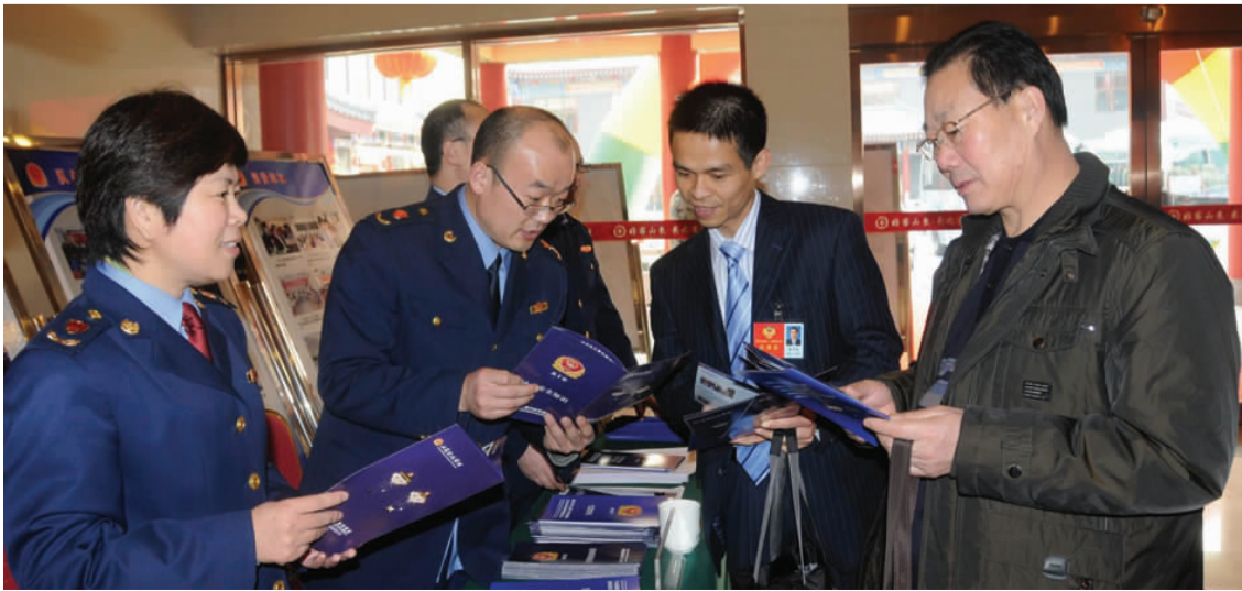
临沂市工商局在市“两会”代表委员分组讨论会场开展咨询服务活动