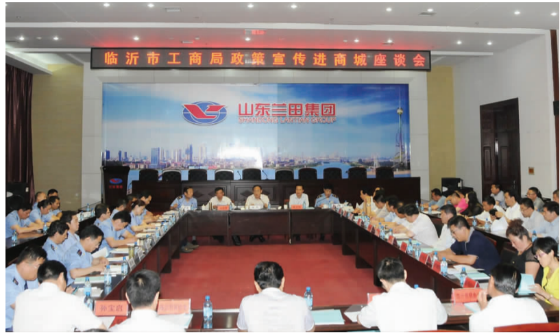
临沂市工商局组织赴各县区和临沂商城开展“政策宣传进企业”服务活动