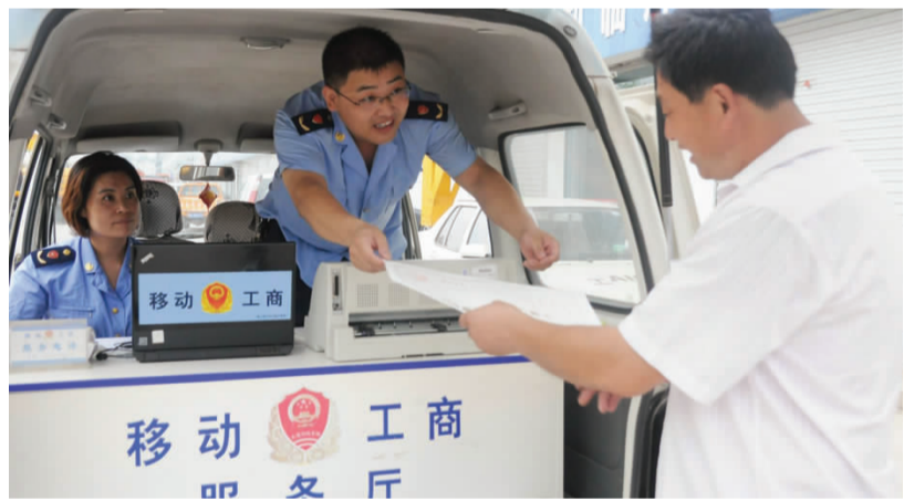
移动工商服务车上门为偏远山区农户办理营业执照