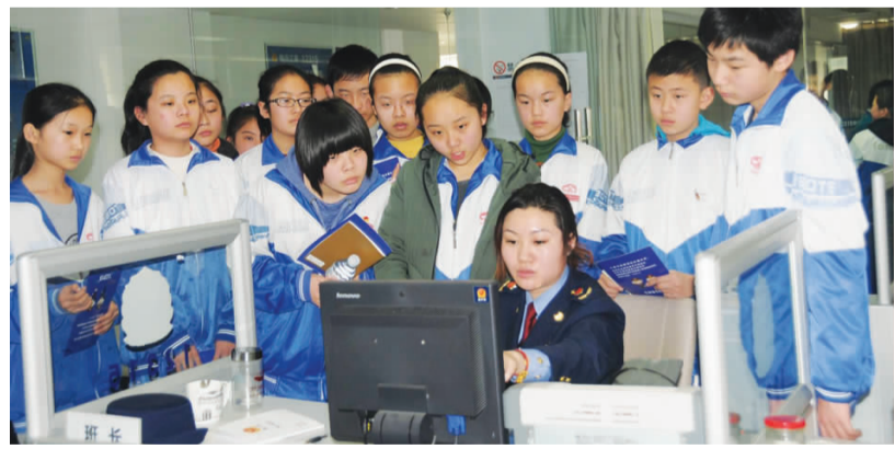
临沂市工商局12315开放日吸引大批学生参加