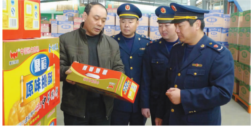
工商人员深入企业调研商标争创工作

同时,我们将推行完善“三项制度”,着力为市场主体提供更加高效、更加便捷的服务。第一,在企业年检上积极落实“亲情服务”制度。进一步简化年检程序,压缩提交企业年检审计报告的范围,并采取集中年检、批量年检、延期年检等方式,提升服务效能。在此基础上,继续慎用吊销营业执照的处罚手段。第二,在市场监管上全面推行“行政指导”制度。对市场主体的轻微违法行为,凡不涉及危害公共安全、食品安全、环境安全,未造成危害后果的,依法给予提示、警示、告诫,指导其按期纠正,减轻或免于行政处罚。第三,在窗口建设上加快推行“网上服务”制度。积极推行网上查询、网上申请、网上登记、网上公示、工商所远程发照、全程电子化年检、电子营业执照等事项,为企业和公众提供更加便利、快捷的网络化服务。