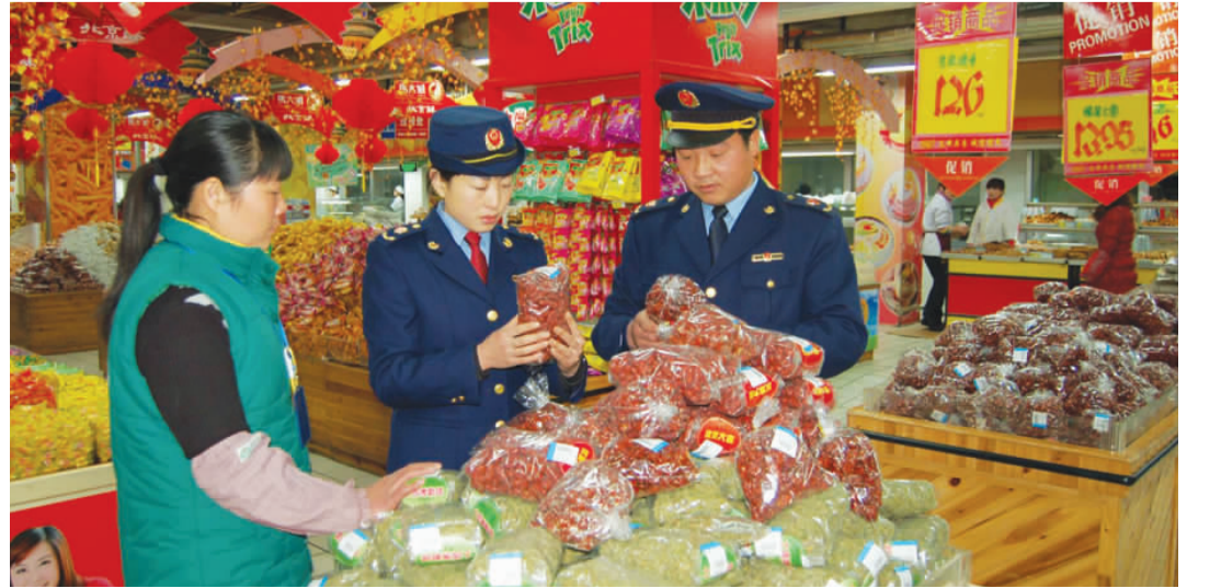
工商执法人员开展节日市场检查