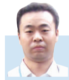
◆庞中鹏 中国社科院日本研究所学者

近日,日本首相安倍晋三对俄罗斯进行了访问。日本急欲谋求发展与俄罗斯的关系,不外乎有两个目的:从确保日本能源安全的角度出发,想要获得俄罗斯远东丰富油气资源的稳定进口;打破日俄岛屿争端处于僵局现状,尽快解决北方四岛的归属问题。