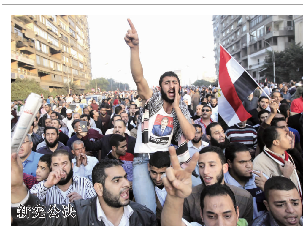
埃及总统穆尔西1日在开罗国际会议中心会见制宪委员会成员后宣布,将于本月15日就刚刚出炉的新宪法草案举行全民公投。穆尔西称,新宪法草案削弱了总统的权力。当日,埃及数万总统支持者与反对者同时举行了大规模游行集会。图为在开罗大学附近,穆尔西的支持者举行集会游行。