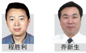
◆导报记者 王伟 济南报道

公务员医疗保障改革再度引发公众关注。日前,中央级公费医疗改革已由国务院常务会议确定,计划于明年纳入职工基本医疗保险体系。