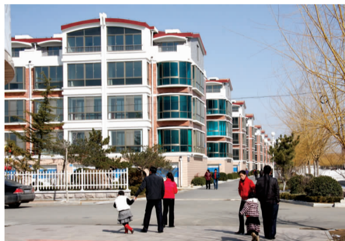
小桥流水、花园洋房,金岭屯村已不是以往人们印象中的农村了