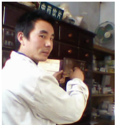
一位村医在忙碌

金的运作效益。在新农合统筹门诊试点方案中,农民不但增加了出资数额,也增加了资金沉淀的可能,这显然有助于增加新农合医疗基金运作的效益。但其最终方案应该在公共财政和效益之间寻找一个平衡点,既要通过充足的财政支持使农民乐意参与,也要使新农合基金运作有高速的效率。