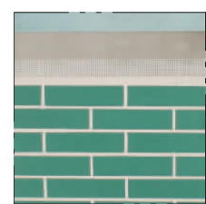
外墙彩色砂浆饰面