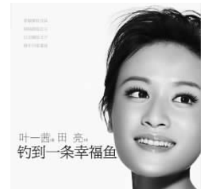
《钓到一条幸福鱼》 叶一茜 著 凤凰联动出版

这是一本关于缔造了苹果神话的史蒂夫·乔布斯的人物传记,他被评为2010年《巴伦周刊》全球年度“最受尊敬CEO”。本书展示他如何“东山再起”,使得苹果公司获得巨大成功。