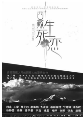
《西藏生死恋》 羽芊 著 文化艺术出版社

书中的故事，或许与很多人息息相关：代孕妈妈、乞丐群落、出租房里的妓女、血奴、酒托群体……那些大量不为人知的事件真相、行业潜规则，种种让人防不胜防的骗术，令人震惊。