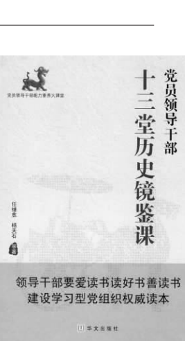
《十三堂历史镜鉴课》 党员领导干部 人文素养与精神境界。

这是一段最纯净的爱情，发生在一个最干净的地方。如果传说会有圆满的一天，那么爱情呢？主人翁“公扎”与喀果的宿命如何结束？他与风能共舞吗？