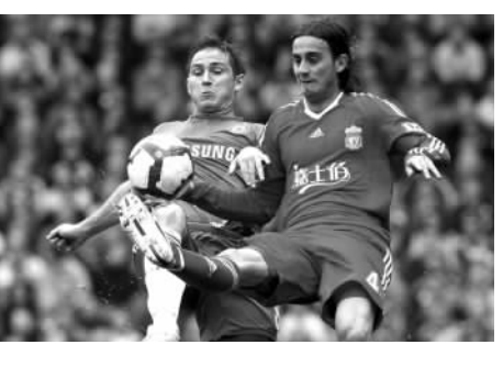
5月2日,切尔西队球员兰帕德(左)与利物浦队球员阿奎拉尼在比赛中拼抢。当日,在英超联赛第37轮比赛中,切尔西队客场以2比0战胜利物浦队。