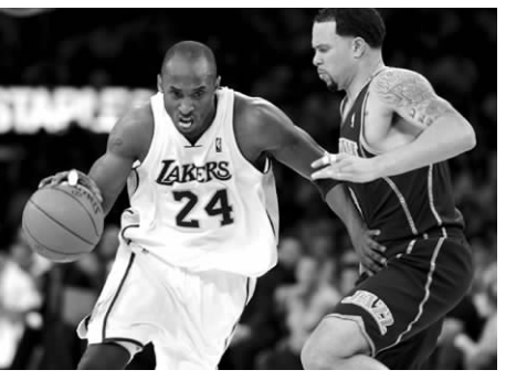
5月2日,湖人队球员科比(左)带球进攻。当日,在NBA季后赛西部半决赛首回合比赛中,洛杉矶湖人队主场以104比99战胜犹他爵士队。 □新华社发

影片讲述1958年春,我国决定在内蒙古阿拉善盟选址,建设导弹试验基地。为了国防建设,老旗长带领额济纳旗数万牧民,腾出了世代生存的天然牧场,向新的牧场迁徙。试验基地的军人们战胜艰难困苦,几年中研制的导弹,火箭连续不断上天,挫败了敌人的阴谋,长了中国人的志气。这期间,纳森旗长的女儿德格玛在沙漠中救起了奄奄一息的军人吴文刚,并悉心照料使他起死回生,额济纳草原上也因此发生了一段荡气回肠的爱情故事。