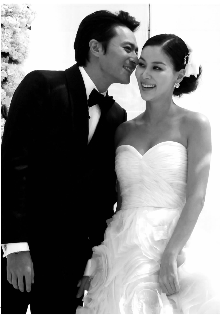
5月2日,韩国,艺人张东健和高小英举行了婚礼。婚礼前,他们面对媒体许下了“我们会恩恩爱爱、幸福地过一辈子!”的诺言。

据国外媒体最新报道,已于4月28日前后在海外部分市场上映的《钢铁侠2》,过去5天里已经豪夺1亿美元票房,在已上映的53个国家和地区里夺下了52个周末票房冠军。而首部《钢铁侠》海外票房一共为5.85亿美元。专业人士预计,《钢铁侠2》本周末北美票房很可能会超过1亿美元。